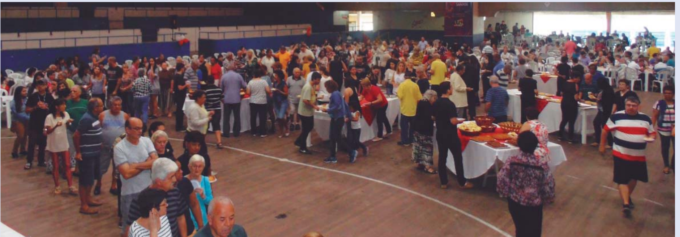
Teve sorteio de cestas no tradicional Café Amigo que aconteceu na A.A. Portuários dia 2 de dezembro