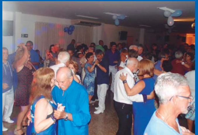
Banda Imagem animou geral dia 17 de novembro