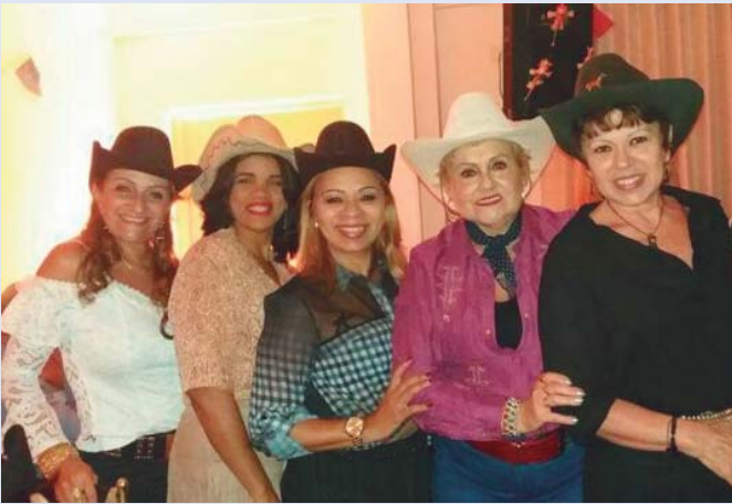
A turma se caracterizou pra festa do final de julho