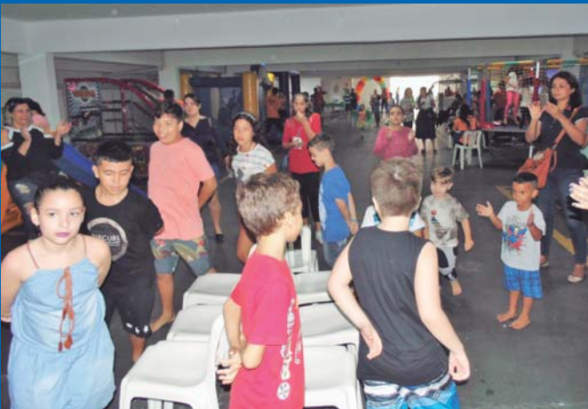
Rolou muita brincadeira pra criançada no dia delas