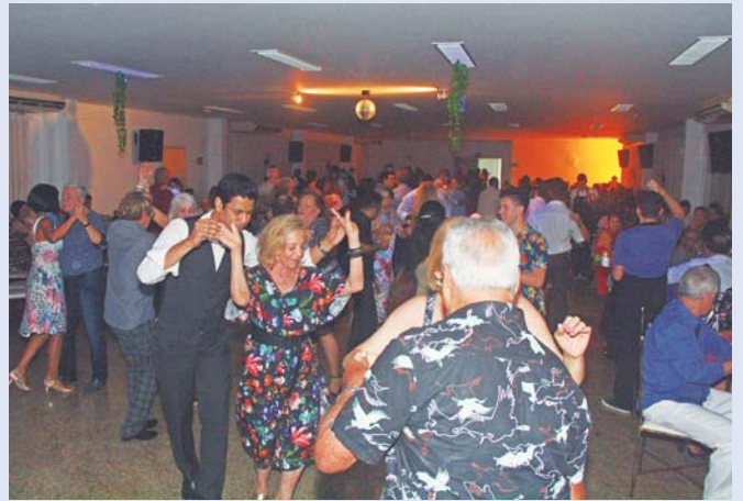
Banda Brasil encheu a pista em 16 de setembro